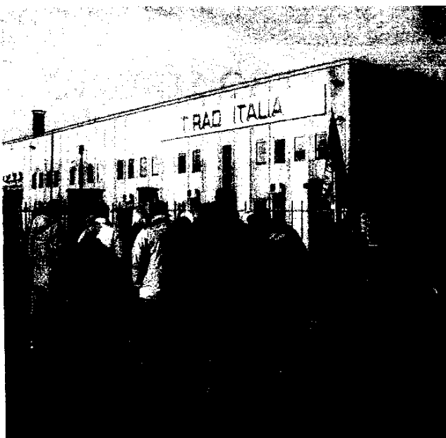
Lavoratori in presidio davanti all'azienda di zona Sandavadò

costi aggiuntivi da sostenere». Cosa accadrà adesso? Nessuno può dirlo, anche se l'augurio di una mediazione tra i sindacati è la priorità delle ultime ore. Se entrambi non firmano un verbale in Regione, la trattativa è in stallo. Maltese specifica «che l'atteggiamento dei giapponesi (i proprietari della T-rad) è stato fin da subito inamovibile. Abbiamo cercato di convincerli in tutti i modi. Loro hanno scelto e non fanno un passo indietro sui licenziamenti».